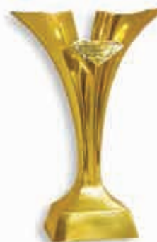
Statuetka Diament Polskiej Innowacyjności